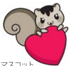
マスコット キャラ「まえリス」